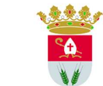
Excmo. Ayuntamiento de San Fulgencio